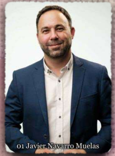
01 Javier Navarro Muelas

Alcalde-presidente del Excmo. Ayuntamiento de Tomelloso.