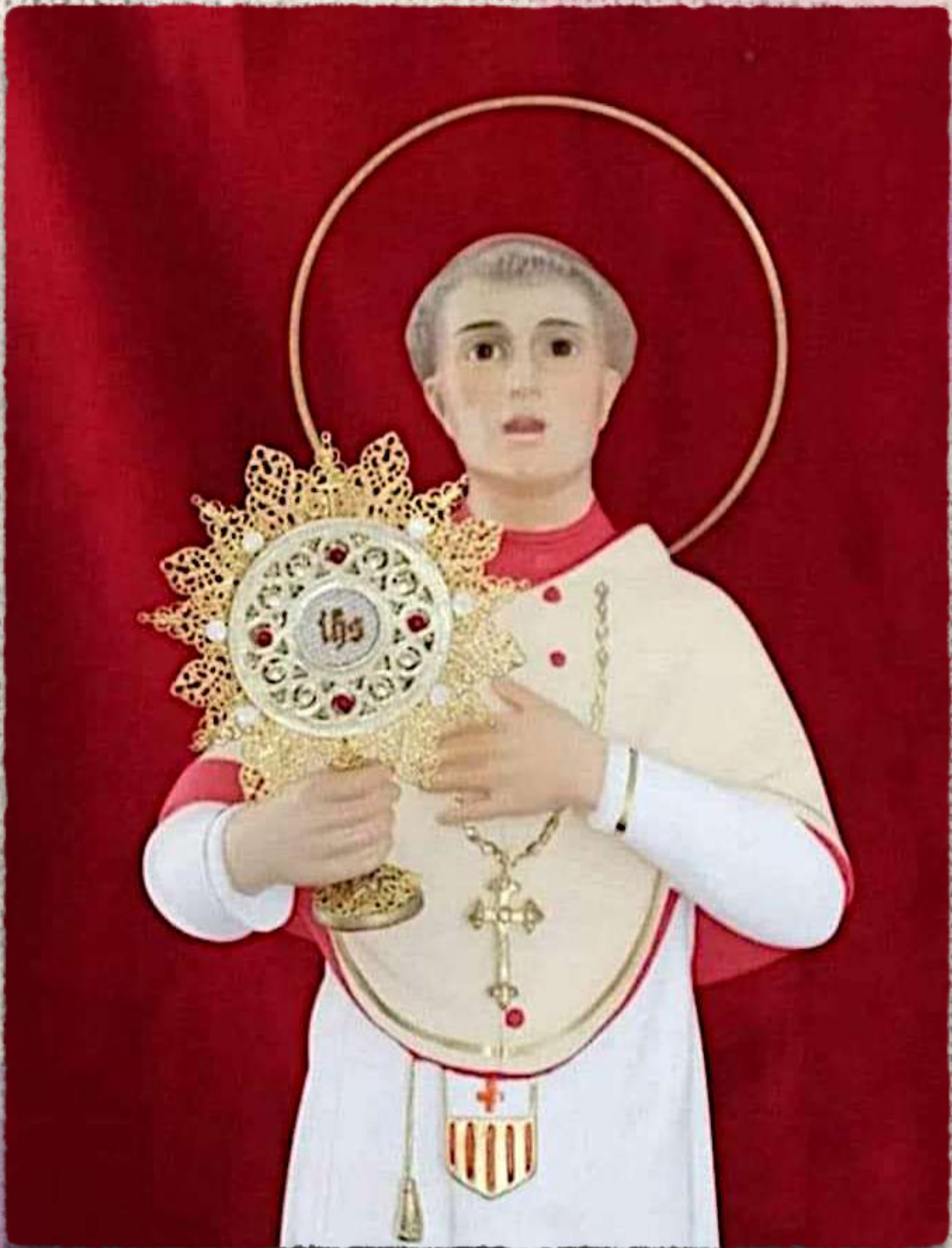
SAN RAMÓN NONATO PATRÓN DEL BARRIO DE MATERNIDAD